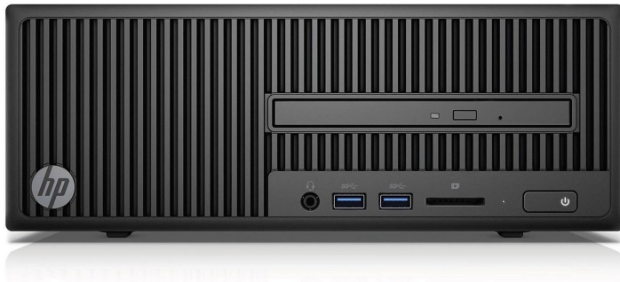
HP 280 G2 SFF Core i3-6100 4GB/1TB FreeDos