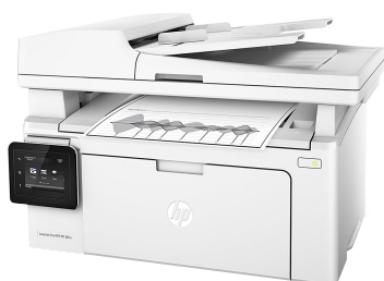
HP MTF M130fw