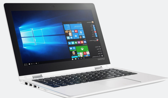
Lenovo NTB Ret 520-15IKB i5-7200U 4GB 2TB 15.6" W10 home