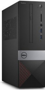
DELL VOSTRO 3267 SFF I3-6100 4GB 1TB DVD-RW WIN 10 PRO W1Y