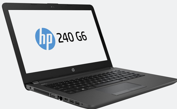
HP 240 G6 Ci5-7200U 14" 4GB/1TB W10Pro64bit