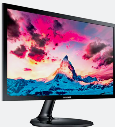
SAM Mon LED 24" LC24F390FHLXZS CURVED HDMI 1920X1080 1800R