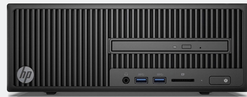
HP Desktop 280 SFF Core i5-6500 4GB/1TB W10 Pro