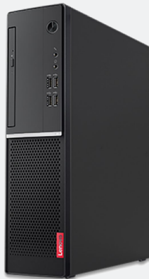
Lenovo - Desktop - Intel Core i5 I5-7400 / 3.06 GHz - 4 GB DDR4 SDRAM - 1 TB Hard Drive Capacity - D