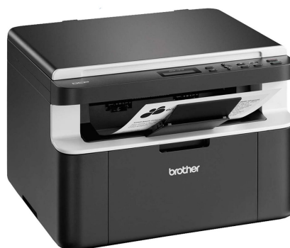
BROTHER MFP LASER DCP1617NW B-N/21 PPM/USB/RED/WiFi