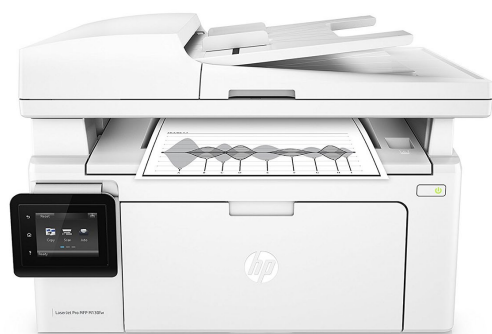
HP Laserjet MFP M130fw 23ppm RED/WIFI