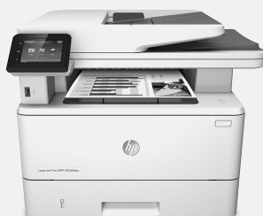
HP LaserJet Pro