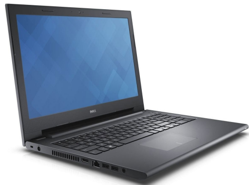
DELL INSPIRON 14-3467 i5-7200U 14" 8GB 1TB DVD-RW Linux