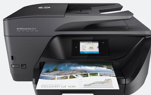
HP OfficeJet Pro 6970 20/11ppm (P/N J7K34A)