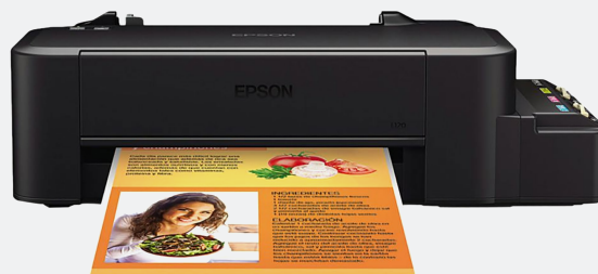
EPS iMP TiNTA ECOTANK L120 CARTA OFICIO 27N/15CPPM/4TTA/L110