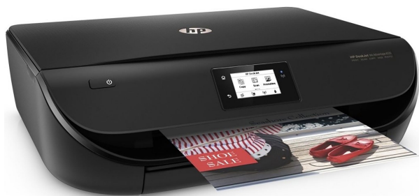
HP Deskjet Ink Advantage 4535 Multifuncional