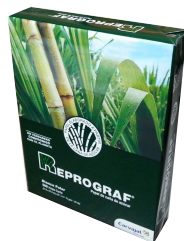
Papel fotocopia carta, 75grs Reprograf