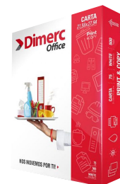
Papel fotocopia carta, 75grs Office