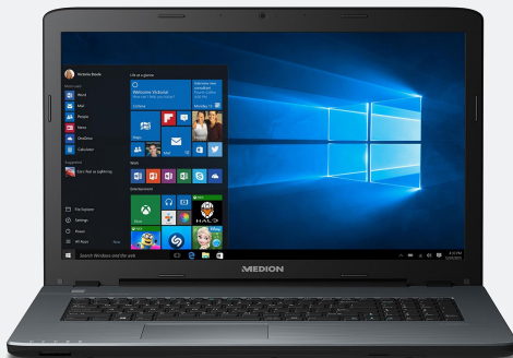
HP NTBK 15-bs005la Intel Pentium N3710 500GB HDD 4 GB 15.6" Windows 10 Home