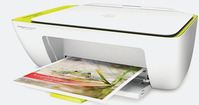
HP Deskjet Ink Advantage 2135 All-in-One Printer