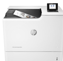
HP Color LaserJet