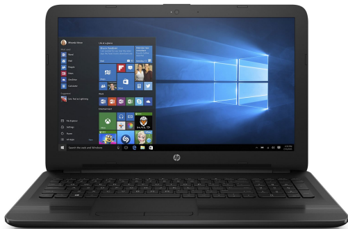
HP NTBK 15-bw006 AMD A9-9420 1TB HDD 12GB 15" Windows 10 Home