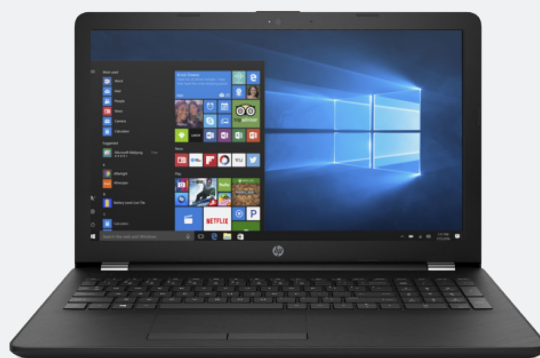
DELL VOSTRO 3468 i5-7200U 14" 8GB 1TB DVD-RW Win10 Pro