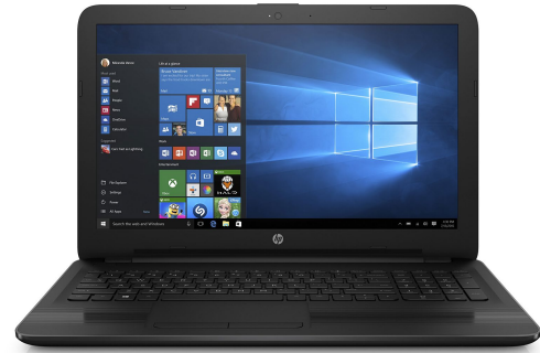
HP 15-bw001la AMD A6-9220 4GB/500 15.6" Radeon R4 Gris W10H