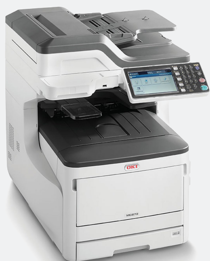
OKI ES8473MFP Modelo Estandar