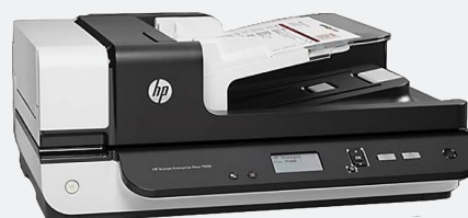
HP Scanjet Ent Flow