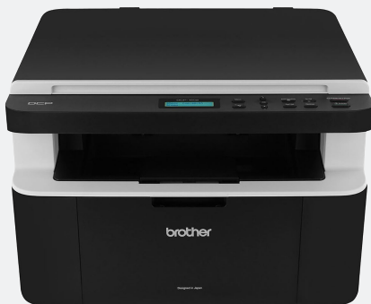
BROTHER MFP LASER DCP1602 B-N/21 PPM/USB