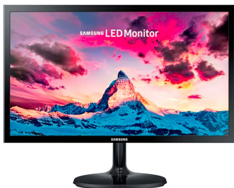
Monitor Samsung LED 22 Pulgadas