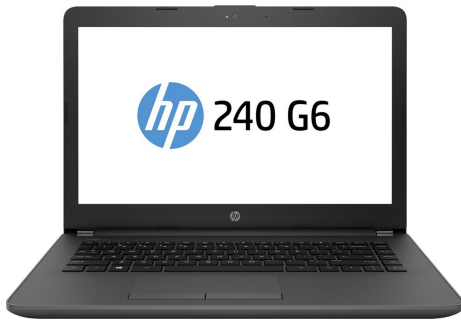
HP 240 G6 Core i3-6006U 4GB 1TB 14" FreeDOS