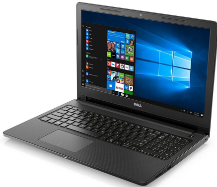
HP 15-bs009la Pentium N3710 4GB/500GB 15.6 Gris 2GB W10Home