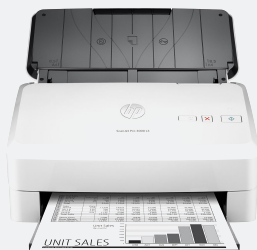
HP Scanjet Pro 3000 s3