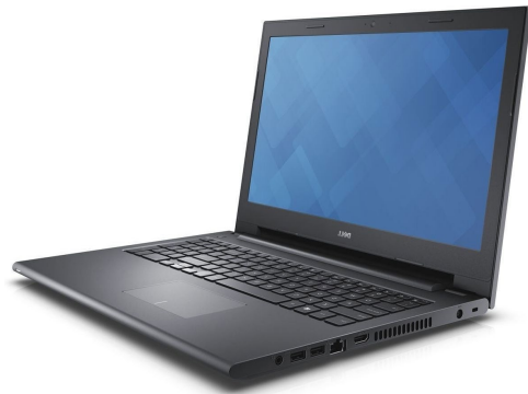
DELL INSPIRON 14-3467 i3-6006U 14" 6GB 1TB DVD-RW Linux