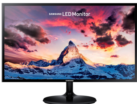
SAM Mon LED 22" LS22F355FHLXZS 1920x1080 HDMI/VGA