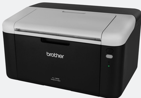
Brother HL 1202