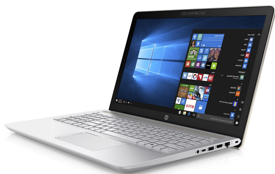
HP NTBK Pavilion 15-cd003la AMD A10-9620P 1TB HDD 12GB 15.6" Windows 10 Home