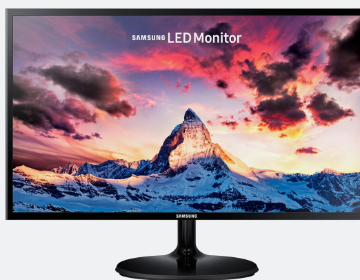
Samsung Monitor 27" LED-LCD 1920x1080 HDMI Black