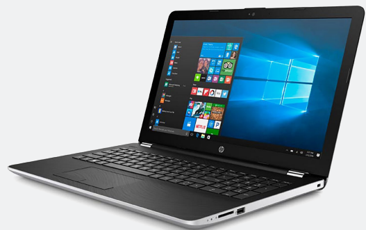
Lenovo NT V310-14ISK Core i5-6200U 4GB/1TB 14" DVD W10 Home