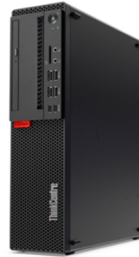
Lenovo Desktop TC M710s i5-7400 500GB 8GB W10 Pro