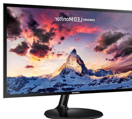
SAM Mon LED 24" LS24F350FHLXZS HDMI/VGA 1920X1080