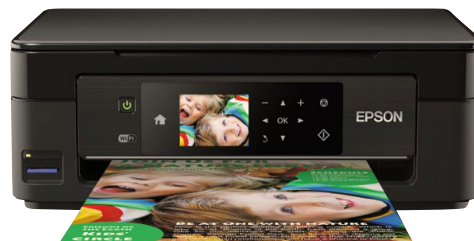
EPS MFP STYLUS XP-441 WiFi 33NEG-15COL/USB/PANTALLA TOUCH