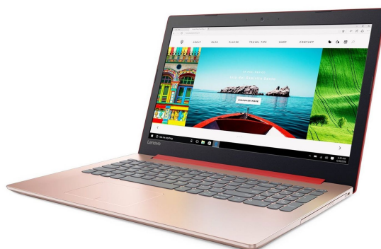
Lenovo NTB Ret 320-15ABR AMD A12-9720P 16GB 1TB 15.6" 2GB Vi