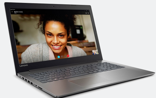
Lenovo NTB Ret 320-14IAP N3350 4GB 500GB 14" Win 10 Home