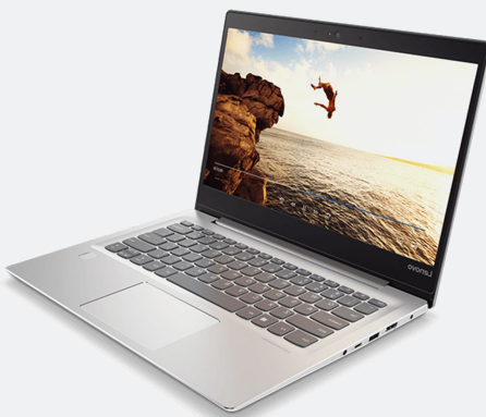
Lenovo NTB Ret 320-14ISK i3-6006U 4GB 1TB 14" Win 10 Home