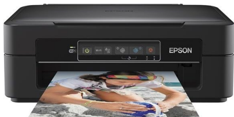
EPS MFP STYLUS XP-241 WiFi 26NEG-13COL/USB/XP-231