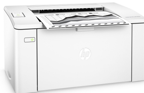
HP LaserJet Pro M102w sin bandj sobre