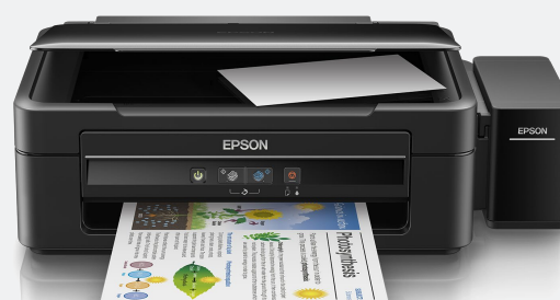
EPS MFP ECOTANK L380 PPM 27NEG/15COL/USB/L220