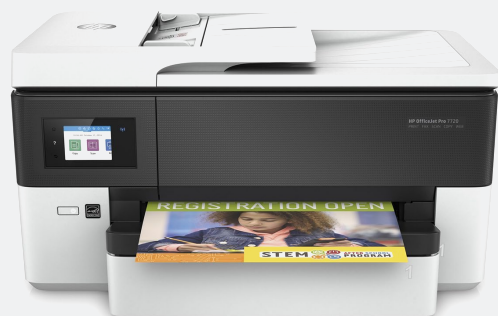
HP Officejet Pro 7720 Printer INKJET 22ppm